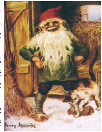
Un nisse, selon J. Nyströms

cadeaux de Noël au Danemark, et s'est ensuite appelé julenisse (« lutin de Noël »). En 1881, le magazine suédois Ny Illustrerad Tidning publia le poème Tomten de Viktor Rydberg, où le tomte, seul éveillé pendant la nuit froide de Noël, considère les mystères de la vie et de la