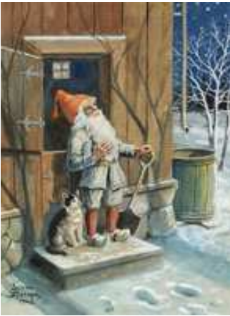
Illustration du poème Tomten par Jenny Nyströms.

A partir des années 1840, le nisse des fermes est devenu le porteur des